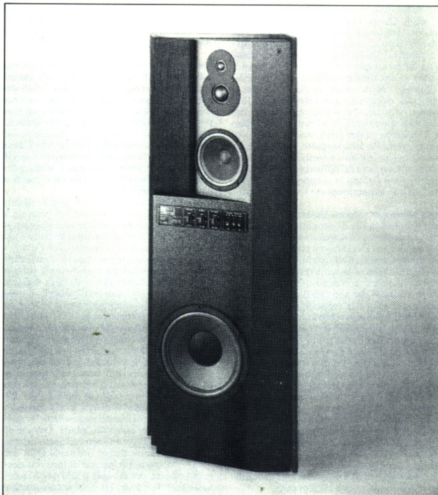
Diffusore ESB 7/06 a spettro distribuito (sistema DSR). Deriva direttamente dal modello di riferimento 7/05 e viene costruito in due versioni: la standard (1.220.000 Lire l'uno) con controlli di livello per le gamme medio-bassa, medio-alta e alta e reference-line (1.117.000 Lire l'uno) senza controlli, ma biamplificabile. Il modello 7/05 è stato presentato nel 1981, mentre la commercializzazione della 7/06 è iniziata a ottobre '82.

Sul modello 7/05 la funzione dei feltri è essenzialmente quella di evitare le riflessioni dal pannello contiguo a quello che contiene gli altoparlanti che è orientato in modo tale da rientrare rispetto al pannello frontale del mobile.